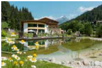
Alpenjoy xxx 2/3